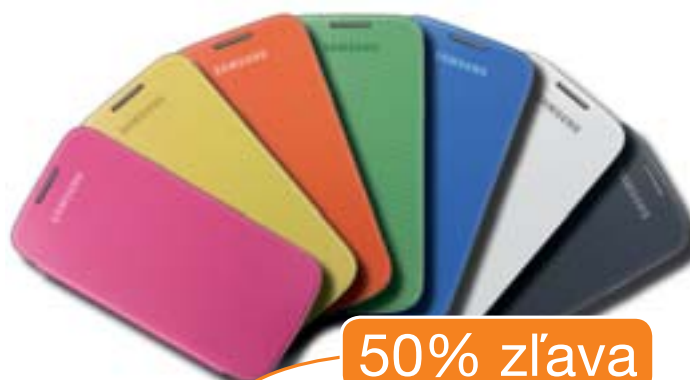
Samsung GALAXY S4 mini