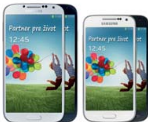
Samsung GALAXY S4

vyberte si špičkový Samsung s originálnym krytom za polovicu